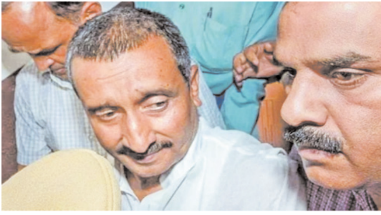
दरअसल, इस घटना के बाद पीड़िता को जिन हालात का सामना करना पड़ा और उसके जीवन तक पर जिस तरह के जोखिम खड़े हुए थे, वे बेहद अप्रत्याशित थे, मगर उससे साफ था कि जघन्य

जाहिर है, अपराध की गंभीरता और प्रकृति के मद्देनजर निचली अदालत में सैंगर को मिली सजा को कानून के मुताबिक माना जा रहा था, लेकिन दिल्ली उच्च न्यायालय ने जिस आधार पर उस सजा को निलंबित करने का आदेश दिया, वह स्वाभाविक ही विवादों के घेरे में आ गया। अब सुप्रीम कोर्ट में एक याचिका दायर कर दिल्ली हाई कोर्ट के आदेश पर रोक लगाने की मांग की गई है।