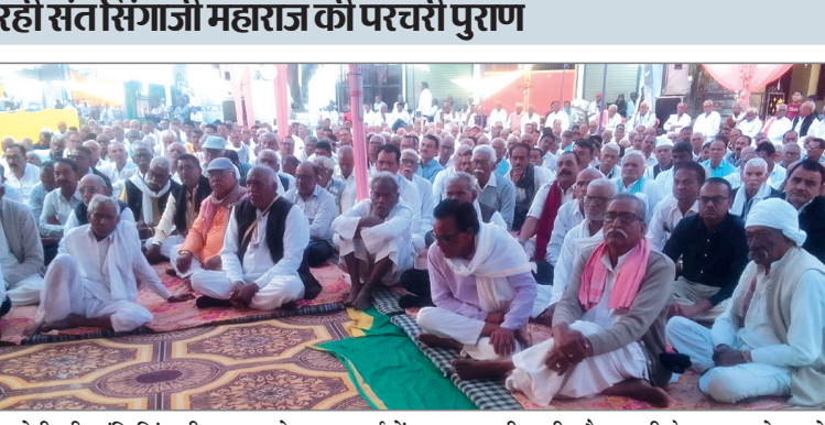
चारखेड़ा में चल रही संत सिंगाजी महाराज की परचरी पुराण