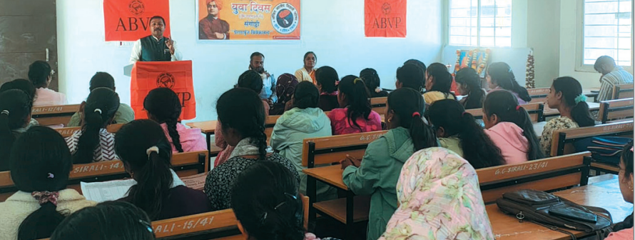
अनोखा तीर, सिराली।

अखिल भारतीय विद्यार्थी परिषद द्वारा राष्ट्रीय युवा दिवस के अवसर पर शासकीय महाविद्यालय में संगोष्ठी का आयोजन किया गया। यह कार्यक्रम स्वामी विवेकानंद की जयंती के उपलक्ष्य में आयोजित किया गया, जिसका उद्देश्य युवाओं को उनके विचारों से प्रेरित कर राष्ट्रनिर्माण के लिए