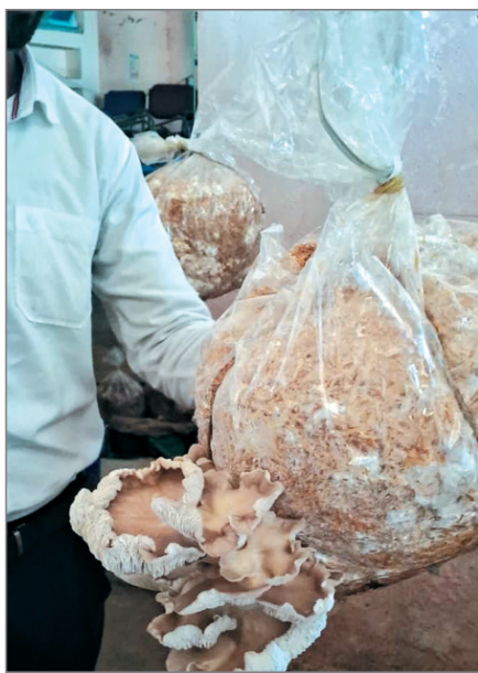
अनोखा तीर, टिमरनी।