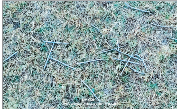
कीलें और गड्डे से पटा खेल मैदान

किसी भी शहर का खेल मैदान वहां की खेल प्रतिभाओं के लिए मंदिर के समान होता है। लेकिन जब वही मैदान अव्यवस्था और लापरवाही की भेंट चढ़ जाए तो खिलाड़ियों का मायूस होना लाजमी है। भैरुंदा के स्थानीय खेल मैदान पर हाल ही में संपन्न हुए सांसद खेल महोत्सव के बाद कुछ ऐसी ही तस्वीर खेल मैदान की उभरकर सामने आई है। जहां आयोजन के दौरान चारों ओर भीड़ और चकाचौंध थी। वहीं वर्तमान में मैदान कचरे के ढेर और गड्डनों में जंझल हो चुका है। विदित है कि बीती 6 जनवरी को सांसद खेल महोत्सव के