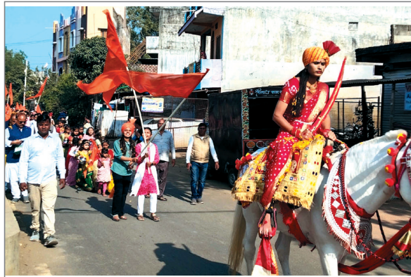
सांस्कृतिक प्रस्तुतियां भी आकर्षण का केंद्र रहीं और आयोजन अनुशासित एवं सुव्यवस्थित रूप से संपन्न हुआ। सम्मेलन के पश्चात सहभोज का आयोजन किया गया, जिसमें समाजजनों ने बड़ी संख्या में सहभागिता कर सामाजिक समरसता का संदेश दिया। समापन अवसर पर शांति, सद्भाव एवं राष्ट्र की उन्नति की कामना के साथ सामूहिक भारत माता की आरती, भजन एवं प्रार्थना की गई। कार्यक्रम में नगर सहित आसपास के क्षेत्रों से बड़ी संख्या में श्रद्धालुओं की उपस्थिति रही, जिससे आयोजन भव्य एवं सफल रहा। उक्त आयोजन हिंदू सम्मेलन आयोजन समिति, सकल हिंदू समाज एवं समस्त नगरवासी हिंदू परिवार, सिराली के संयुक्त तत्वावधान में संपन्न हुआ।