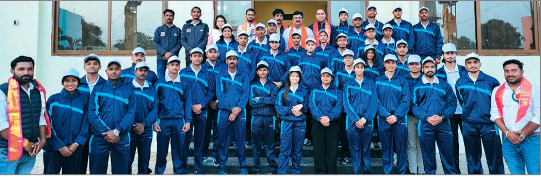
अनोखा तीर, हरदा।