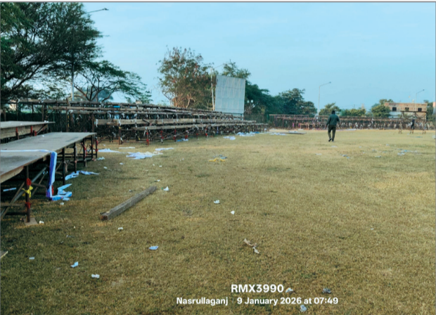
अनोखा तीर, भैरुंदा।

किसी भी शहर का खेल मैदान वहां की खेल प्रतिभाओं के लिए मंदिर के समान होता है। लेकिन जब वही मैदान अव्यवस्था और लापरवाही की भेंट चढ़ जाए तो खिलाड़ियों का मायूस होना लाजमी है। भैरुंदा के स्थानीय खेल मैदान पर हाल ही में संपन्न हुए सांसद खेल महोत्सव के बाद कुछ ऐसी ही तस्वीर खेल मैदान की उभरकर सामने आई है। जहां आयोजन के दौरान चारों ओर भीड़ और चकाचौंध थी। वहीं वर्तमान में मैदान कचरे के ढेर और गड्डनों में जंझल हो चुका है। विदित है कि बीती 6 जनवरी को सांसद खेल महोत्सव के