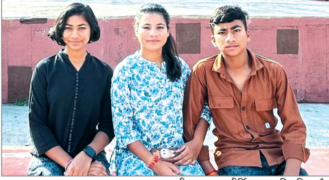
अनोखा तीर, खंडवा।

नर्मदा की लहरों के बीच पले-बढ़े सिंगाजी क्षेत्र के ढीमर परिवार ने यह साबित कर दिया कि हालात चाहे कितने भी कठिन हों, मेहनत, लगन और आत्मविश्वास से अंतरराष्ट्रीय पहचान बनाई जा सकती है। जिस परिवार ने कभी कर्ज चुकाने के लिए रात-रात भर नाव चलाकर मछली पकड़ी, आज उसी परिवार के तीनों भाई-बहन कयाकिंग-कैनोइंग जैसे विदेशी जलखेल में देश और प्रदेश का नाम विश्व स्तर पर रोशन कर रहे हैं।