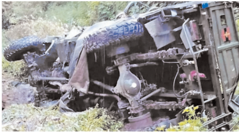
जिंदा बचने की गुंजाइश बेहद कम होती है। अफसोस की बात यह है कि उस समूचे क्षेत्र में

तैनात सुरक्षा बलों के सामने एक अतिरिक्त चुनौती का पता चलता है। यह इलाका अपनी बेहद मुश्किल भौगोलिक परिस्थितियों के लिए जाना जाता रहा है और वहाँ सुरक्षा बलों के जवानों के सामने हमेशा ही जोखिम की स्थिति बनी रहती है। ऊंचे पहाड़ों और घने जंगलों के बीच आतंकवादियों का सामना करना पहले ही एक बड़ी चुनौती रही है। उसमें जब सुरक्षा कारणों से ही सड़कों पर सफर के क्रम में हुए हादसे में जवानों की मौत हो जाती है, तो यह वाहन चलाने में हुई मामूली चूक के खतरनाक नतीजों के साथ-साथ दुर्गम इलाकों में मौजूद रास्तों के बेहद असुरक्षित होने का भी सबूत है। सवाल है कि देश की सुरक्षा के लिहाज से अतिसंवेदनशील इलाकों में सड़कों को इस हालत में कैसे छोड़ा गया है कि किसी वाहन के खाई में गिरने के बाद उसमें सवार लोगों के