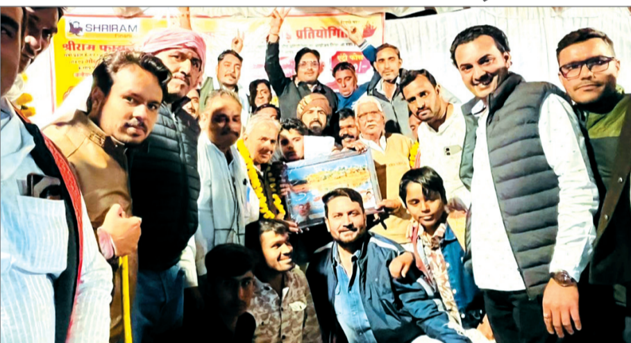
अनोखा तीर, हरदा।

इन्दौर-नापुर फोरलेन पर स्थित जेवल्या कृषि फार्म पर रविवार को विशाल बैलाड़ी दौड़ प्रतियोगिता का आयोजन हुआ। जिसमें हरदा समेत बैतूल, देवास, नर्मदापुरम, खंडवा सहित अन्य जिले की दौड़जोड़ियों ने हिस्सा लिया। इस मौके पर पूरा ग्राउंड दर्शकों से खचाखच भरा हुआ था। दौड़