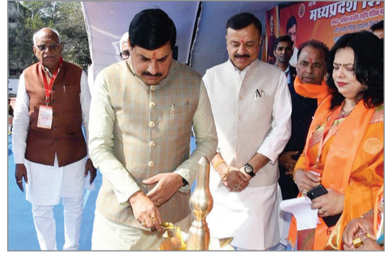
अनोखा तीर, भोपाल ।

नवाचार और उत्कृष्ट प्रदर्शन करने वाले टीचर्स का भी हुआ सम्मान