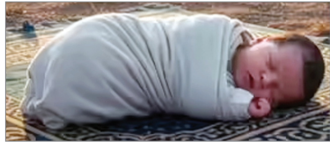
धिवपुरी (एजेंसी) ।

देहात थानांतगत ईदगाह परिसर में एक महिला रूई में छिपाकर एक नवजात को लेकर आई। उसे ईदगाह परिसर में फेंक कर चली गई। नवजात को फेंकने के लिए आई महिला ईदगाह पर लगे सीसीटीवी कैमरों में कैद हो गई है। पुलिस महिला की तलाश कर रही है।