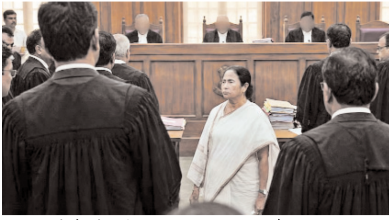
पर सूचित करने और उन्हें अपनी पात्रता साबित करने के पर्याप्त अवसर देने को लेकर सवाल उठाना स्वाभाविक है। जाहिर है, अगर पुनरीक्षण को निष्पक्ष और

गौरतलब है कि पुनरीक्षण की प्रक्रिया के दौरान बड़ी संख्या में ऐसी शिकायतें सामने आई हैं कि नागरिकों के नाम मनमाने तरीके से मतदाता सूची से बाहर कर दिए गए और उन्हें इस संबंध में कारणों की जानकारी भी नहीं दी गई। ऐसे में निर्वाचन आयोग की इस प्रक्रिया में मतदाता सूची से बाहर होने वाले लोगों को समय