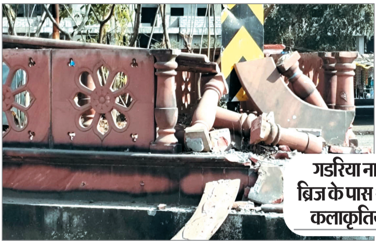
गडरिया नाला फोर लेन ब्रिज के पास शहर प्रवेश की कलाकृतियां क्षतिग्रस्त