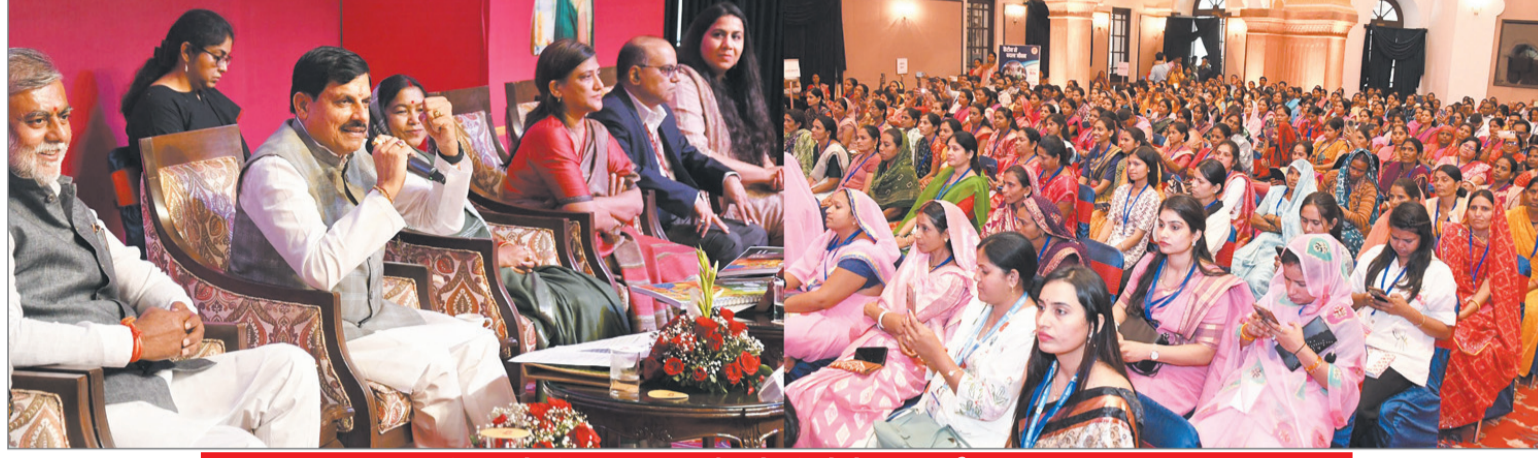
सीएम ने किया आगरा के होली मेले का वर्युअल शुभारंभ

हरदा, गुरुवार वर्ष-15, अंक - 262, पृष्ठ-8 मूल्य- 2 रुपए फाल्गुन शुक्ल पक्ष - 9 विक्रम संवत् 2082