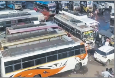
अनोखा तीर, भोपाल ।

मध्य प्रदेश के 55 जिलों में 2 मार्च यानी होली से ठीक 2 दिन पहले बसों की हड़ताल होगी। इसमें प्रदेश की 20 हजार बसें शामिल होंगी। मध्य प्रदेश बस ऑपरेटर्स एसोसिएशन के मुताबिक, प्रदेश में 12 हजार 780 परमिट वाली जबकि 7 हजार से अधिक कॉन्ट्रैक्ट वाली बसें हैं।