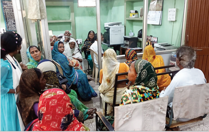
मुख्यमंत्री डॉ. यादव ने सामाजिक सुरक्षा पेंशन की राशि हितग्राहियों के खातों में अंतरित की।

जिले के 55 हजार 700 हितग्राहियों को सिंगल विलक के माध्यम से मिला पेंशन लाभ