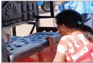
अनोखा तीर, भोपाल ।

भोपाल में दो पुलिसकर्मियों ने ई रिक्शाचालक युवक से बदसलूकी की तो उसकी पत्नी ने जहर खा लिया। गुस्साए युवक ने सड़क के बीच में ही रिक्शा पार्क कर दिया, जिससे जाम के हालत बन गए। फिर पुलिसकर्मियों से भीड़ गया। खूब खरी-खोटी सुनवाई। उनकी बाइक पलट दी। इसके बाद दोनों