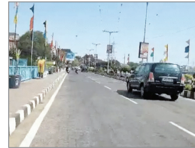
अनोखा तीर, भोपाल ।

भोपाल (नप्र)। मध्य प्रदेश में आंधी, बारिश और ओले का दौर थमने के बाद गर्मी का असर बढ़ा है। बुधवार को भोपाल, इंदौर, उज्जैन, ग्वालियर-जबलपुर समेत प्रदेश के 28 जिलों में दिन का तापमान 30 डिग्री के पार पहुंच गया। मौसम विभाग