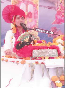
अनोखा तीर, सिराली।