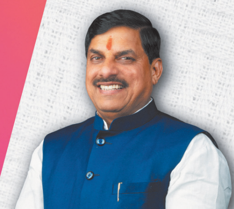
डॉ. मोहन यादव, मुख्यमंत्री

मुख्य अतिथि डॉ. मोहन यादव मुख्यमंत्री, मध्यप्रदेश