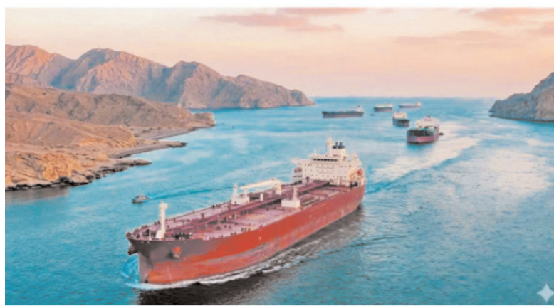
कहा कि हमने कुछ ऐसे देशों को होर्मुज हम मित्र मानते हैं। इसमें चीन, रूस, भारत, इराक तथा जलडमरूमध्य से गुजरने की इजाजत दी है, जिन्हें

है, उनमें भारत भी शामिल है। यों भारत आने वाले चार जहाज पहले ही होर्मुज जलमार्ग को पार कर चुके हैं, लेकिन अठारह जहाज उसी इलाके में फंसे हुए थे। ईरान के ताजा रुख के बाद उम्मीद जताई जा रही है कि भारत के बाकी जहाज वहां से निकल कर आ सकेंगे और इससे देश में तेल और गैस के गहराते संकट को कम करने में मदद मिलेगी। हालांकि अमेरिका और इजरायल को लेकर ईरान अब भी सख्त है और शांति प्रस्तावों को लेकर भी उसने कोई सकारात्मक प्रतिक्रिया नहीं दी है। मगर होर्मुज जलमार्ग पर उसके रुख में आई नरमी से दुनिया के कुछ देशों को राहत मिल सकती है। बाकी ईरान जिन्हें शत्रु देश मानता है, उनके जलपोतों को लेकर वह अब भी सख्त है। जहां तक भारत का सवाल है, तो ईरान के विदेश मंत्री ने