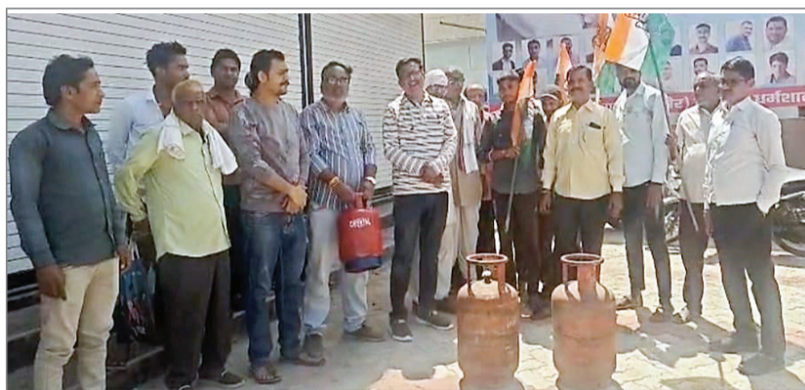
अनोखा तीर, बुधनी।

तहसील कार्यालय के पास सिलेंडर के साथ किया विरोध, जांच और आपूर्ति सुधारने की मांग