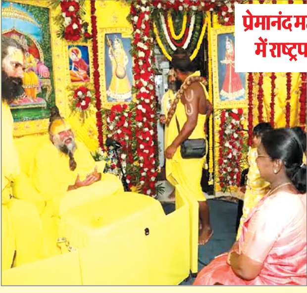
प्रेमानंद महाराज के दरबार में राष्ट्रपति द्रौपदी मुर्मू