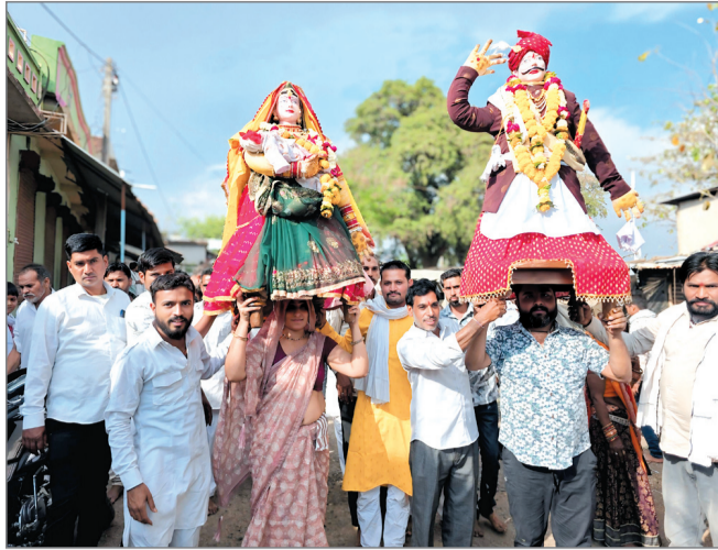
प्रस्तुति दी गई, जिसने उपस्थित जनसमूह को देर रात तक बांधे रखा।। पूरे आयोजन के दौरान क्षेत्र में भक्ति और उत्साह का माहौल बना रहा।