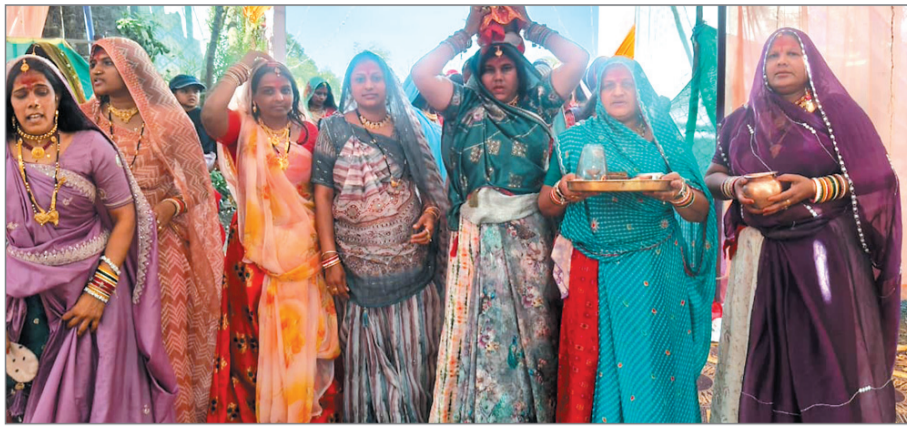
अनोखा तीर, बालागांव।

ग्राम बालागांव में आयोजित गणगौर महोत्सव पूरे उत्साह और श्रद्धा के साथ मनाया जा रहा है। महोत्सव के पांचवें दिवस विभिन्न मंडलों द्वारा आकर्षक प्रस्तुतियां दी गईं, जिन्हें देखने के लिए गांव सहित आसपास के क्षेत्रों से बड़ी