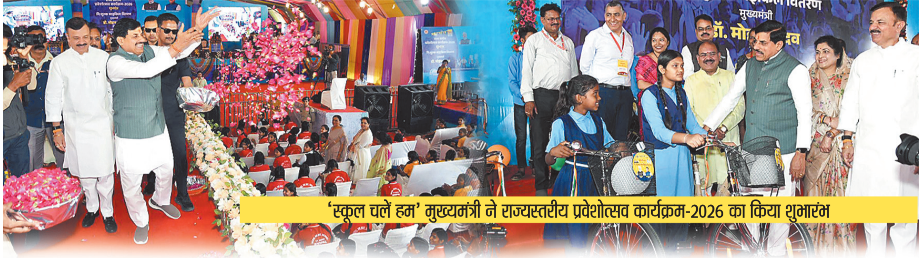
'स्कूल चलें हम' मुख्यमंत्री ने राज्यस्तरीय प्रवेशोत्सव कार्यक्रम-2026 का किया शुभारंभ

जा रहे हैं। अब कृषि प्रयोजन के लिए उपयोग किये जाने वाले कंबाइन हार्वेस्टरों को मध्यप्रदेश सड़क विकास निगम के टोल प्लाजा पर शुल्क संग्रहण से छूट रहेगी। मुख्यमंत्री डॉ. यादव ने कहा कि फसल कटाई में प्रयुक्त