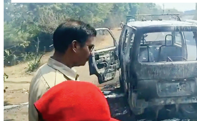
एंबुलेंस ने आग पकड़ ली। आग बुझाने का प्रयास किया गया, लेकिन तेजी से फैलने के कारण एंबुलेंस पूरी तरह जलकर खाक हो गई। मरीज को दूसरी एंबुलेंस से नर्मदापुरम भेजा गया। पुलिस ने बताया कि आग लगने का कारण अभी स्पष्ट नहीं है, मामले को जांच में लिया गया है।