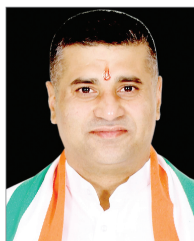
संवैधानिक अधिकार दिलाने का प्रश्न है। उन्होंने कहा कि वर्ष 2023 में बिल पारित होने के बावजूद अब तक इसे लागू नहीं करना महिलाओं के साथ