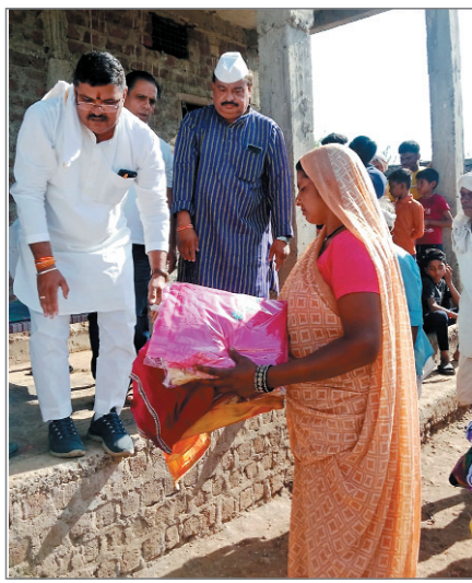
अनोखा तीर, हरदा।

टिमरनी विधानसभा अंतर्गत रहतगांव ब्लॉक के ग्राम बड़झिरी में आगजनी की घटना में 8 परिवारों के घर जलकर राख हो गए थे। इस घटना के बाद करीब 70 दानदाताओं के सहयोग से 65 हजार रुपये की राशि एकत्रित कर प्रभावित