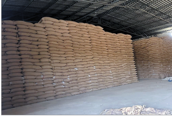
जांचकारियों के अनुसार किसानों कि स्लाट बुकिंग मात्र 1500 क्विंटल की ही हुई है, इसके बावजूद वेयर हाऊस संचालक

एक ओर जहां किसान समर्थन मूल्य पर अपना गेहूं बेचने के लिए जदोजहद कर रहा है। वहीं दूसरी ओर खरीदी कार्य में संलग्न समिति और वेयर हाऊस संचालक मिलकर शासन को चूना लगाने में कोई कोर-कसर नहीं छोड़ रहे हैं। मामला खिरकिया तहसील के मुहाल में स्थित समृद्धि वेयर हाऊस का है। यहां पर वेयर हाऊस संचालक ने पहले से ही हजारों क्विंटल गेहूं समर्थन मूल्य पर बेचने के लिए ओने-पोने दामों पर खरीद कर स्टॉक कर उसे समर्थन मूल्य पर गेहूं खरीदने के लिए आई बोरियों में भराकर रख लिया था। हाई प्रोफाइल व्यक्ति का वेयर हाऊस होने के कारण मामले को दवाने का प्रयास किया जा रहा है। जांच टीम ने मौके पर पहुंचकर वेयर हाऊस संचालक और समितिद्वारा किए गए इस मामले को पकड़ भी लिया है, इसके बावजूद जिला प्रशासन द्वारा इस मामले का खुलासा नहीं किया गया।