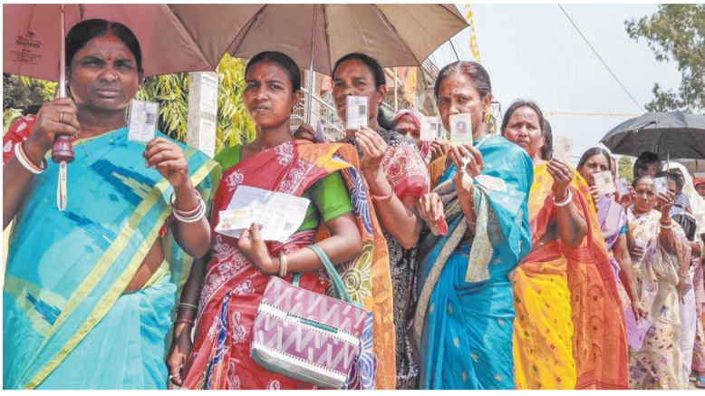
है, जिसने बहुत सारे लोगों को अपना वोट हर हाल में डालने को लेकर जागरूक किया। तमिलनाडु में भी कमोबेश स्थिति यही रही। दिलचस्प यह है कि इन दोनों राज्यों के चुनाव

जाहिर है, इतनी बड़ी संख्या में नागरिकों ने अगर मतदान किया है, तो इसके पीछे मुख्य कारण संवैधानिक अधिकारों के प्रति जनता के बीच फैली व्यापक जागरूकता है और यह देश के लोकतंत्र के लिए एक सुखद संकेत है। हालांकि पश्चिम बंगाल में होने वाले किसी भी चुनाव में मतदान का फीसद सामान्य तौर पर अन्य राज्यों के मुकाबले ज्यादा रहता है, लेकिन इस बार का आंकड़ा अगर इतना ऊंचा गया है, तो इसकी वजह वहां के राजनीतिक माहौल में प्रतिद्वंद्वी दलों के बीच आक्रामक खींचतान से पैदा हुआ उद्वेलन भी