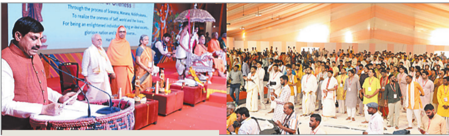
पं. दीनदयाल उपाध्याय के अंत्योदय के सिद्धांत में होती है एकात्मता के भाव की अभिव्यक्ति

भोपाल (नप्र)। मुख्यमंत्री डॉ. मोहन यादव ने कहा है कि अद्वैत ज्ञान के सूर्योदय के केन्द्र ओंकारेश्वर की चेतना की अनुभूति आज सबको हो रही है। ज्ञान और ध्यान की धरती मध्यप्रदेश ने ऐतिहासिक रूप से धर्म, संस्कृति और आध्यात्मिक ऊर्जा का संचार किया है। हर युग में इसके प्रमाण विद्यमान हैं। श्रीरामचन्द्र जी वनवास मिलने पर मंदाकिनो माता के किनारे चित्रकूट के धाम पधारें और प्रभु श्रीराम का आगे का जीवन मानव मात्र के लिए पूजनीय हो गया, समाज ने रामराज्य का अनुभव प्राप्त किया। भगवान श्रीराम ने संस्कारों, व्यवहारगत मूल्यों, परस्पर संबंधों सहित शासन के ऐसे सूत्र प्रदान किए जो आज भी महत्वपूर्ण हैं। इसी प्रकार श्रीकृष्ण, कंस वध के बाद शिक्षा ग्रहण करने उज्जयिनी स्थित सांदीपनि आश्रम पधारें। इसके बाद भगवान श्रीकृष्ण ने कर्मवाद का संदेश दिया, जो वर्तमान में भी प्रासंगिक है। सनातन काल में कालड़ी केरल से चले 8 वर्षीय बालक शंकर ओंकारेश्वर पधारें, जहां परम पूज्य गुरु गोविंदपाद जी के आशीर्वाद से आदि शंकराचार्य बनकर सनातन धर्म की धारा को अविचल रूप