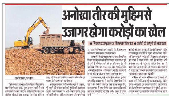
अनोखा तीर, खरगोन। शिवहरे इंफ्रास्ट्रक्चर प्रा. लि. के अवैध उत्खनन का बड़ा मामला उजागर हुआ है।

सबकी नजर टिकी है। खरगोन जिले के गोगावां तहसील अंतर्गत ग्राम मेहरजा और डाबरिया में मुरुम के अवैध उत्खनन का बड़ा मामला सामने आया है। सीएम हेल्थलाइन में प्राप्त शिकायतों के साथ-साथ दैनिक अनोखा तीर द्वारा लगातार प्रकाशित खबरों ने इस पूरे मामले को उजागर करने में अहम भूमिका निभाई। दैनिक अनोखा तीर ने इस मुद्दे को प्रमुखता से उठाते हुए