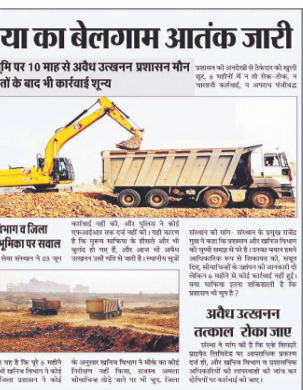
अनोखा तीर, खरगोन। शिवहरे इंफ्रास्ट्रक्चर प्रा. लि. के अवैध उत्खनन का बड़ा मामला उजागर हुआ है।

अनोखा तीर, खरगोन। जिले के गोगावां तहसील अंतर्गत ग्राम मेहरजा और डाबरिया में मुरुम के अवैध उत्खनन का बड़ा मामला उजागर हुआ है, जिसमें सड़क निर्माण कंपनी एक शिवहरे इंफा प्रा. लि., भोपाल द्वारा स्वीकृत सीमा से बाहर जाकर भारी मात्रा में खनन किया गया। इस पूरे प्रकरण को लेकर दैनिक अनोखा तीर द्वारा लगातार समाचार प्रकाशित कर प्रशासन का ध्यान आकर्षित किया गया। खबर का असर यह रहा कि कलेक्टर के निर्देश पर राजस्व और खनिज विभाग की संयुक्त टीम ने तीन दिन तक मौके पर गहन जांच की। जांच में 1.71 लाख घनमीटर से अधिक मुरुम का अवैध उत्खनन सामने आया। सीमांकन के दौरान कई स्थानों पर बड़े-बड़े गड्ढे पाए गए, जो नियमों के उल्लंघन को स्पष्ट करते हैं। इस मामले में करोड़ों रुपए की शांति प्रस्तावित की गई है, जिससे जिले में हड़कंप मच गया है और अब प्रशासनिक कार्रवाई पर