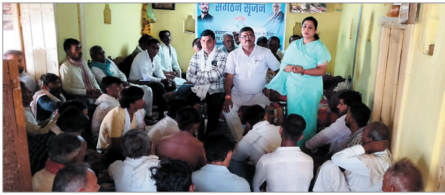
अनोखा तीर, हरदा/विवरणिका।